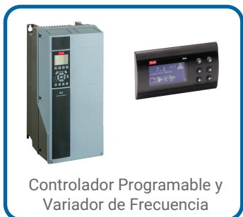
Controlador Programable y Variador de Frecuencia